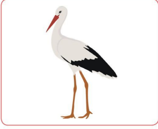
uzun gagalı leylek

6. Aşağıda verilen varlık ya da kavramların özelliklerini örnekteki gibi şiiirden bulup yazalım.