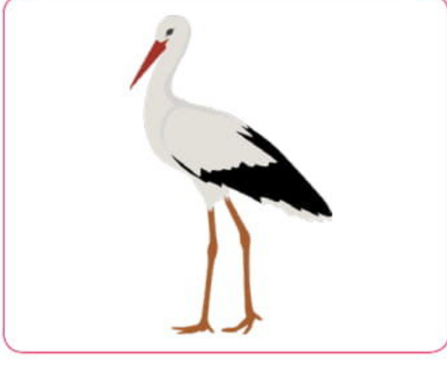
uzun gagalı leylek

6. Aşağıda verilen varlık ya da kavramların özelliklerini örnekteki gibi şirden bulup yazalım.