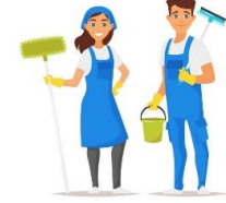
Yardımcı Hizmet Personeli

Ben okulu yönetirim. Okulla ilgili her durum- la ben ilgilenirim.