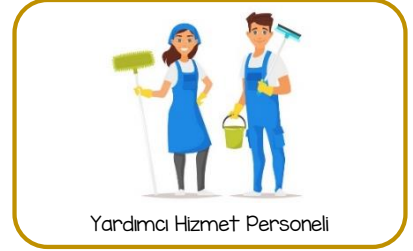
Yardımcı Hizmet Personeli

Suluğumdaki tüm su sınıfa döküldü. Yardım edebilir misiniz?