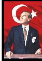
M. Kemal ATATÜRK