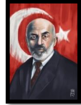
M. Akif ERSOY